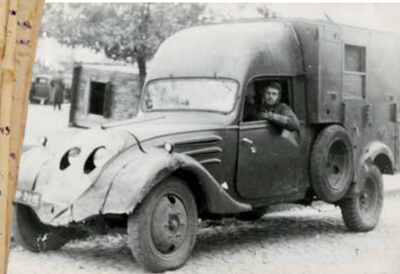
Автомобиль санэпидстанции. 1948 г.

Страна развивалась, пограничный город Брест занимал на карте СССР особенное место. На его территории разместились несколько военных городков, на западных границах Советского Союза было решено развивать крупный промышленный узел.