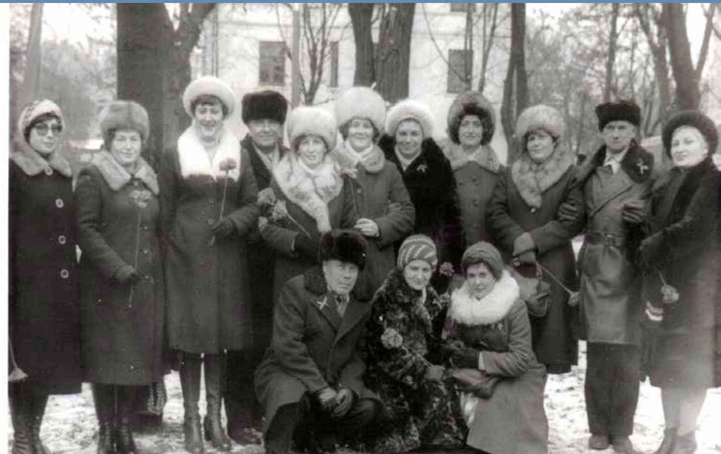
7 ноября 1981 г.