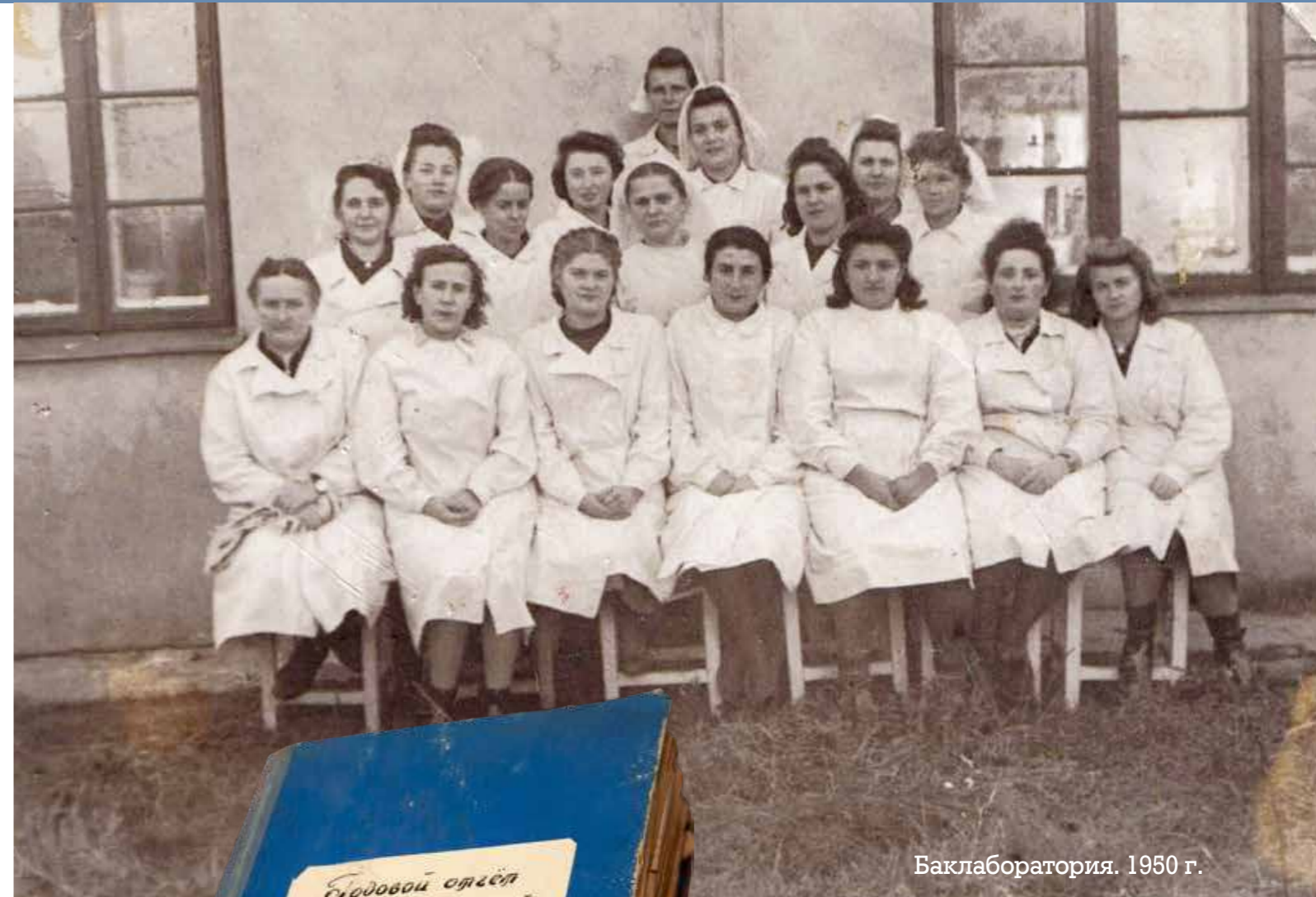
Баклаборатория. 1950 г.

В 1973 году отделение профилактической дезинфекции разместилось в одном из корпусов бывшей инфекционной больницы на ул. Московской, 80, в 1982 году переехало на ул. Веры Хоружей, 6.