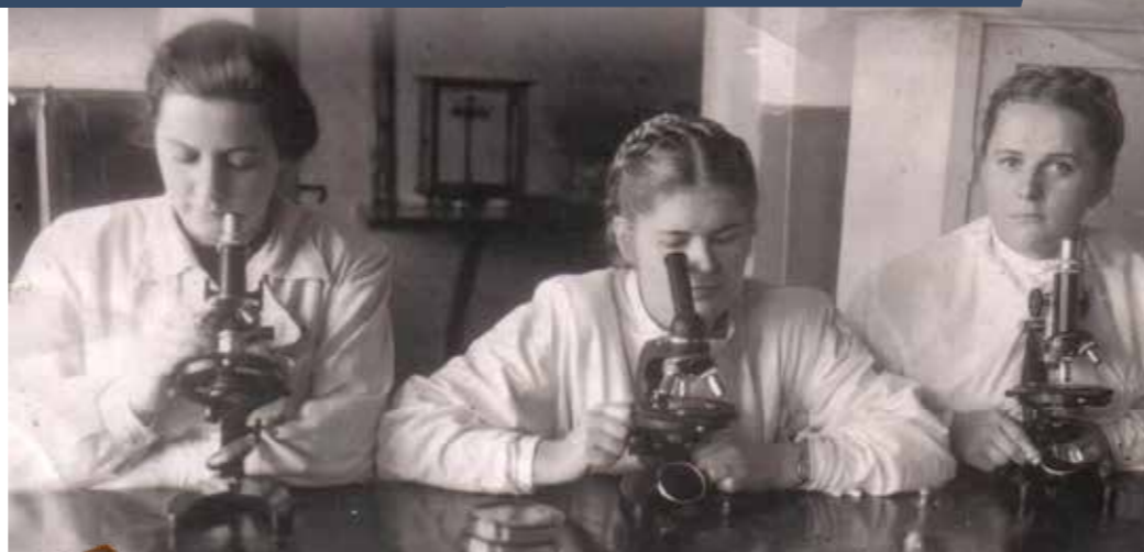
Бактериологическая лаборатория. 1951 г.

Воссоединение Западной Белоруссии с БССР потребовало масштабной реорганизации в здравоохранении Брестской области. В январе 1940 года была создана Брестская областная санитарно-эпидемиологическая станция. В границы ее обслуживания вошел и город Брест.