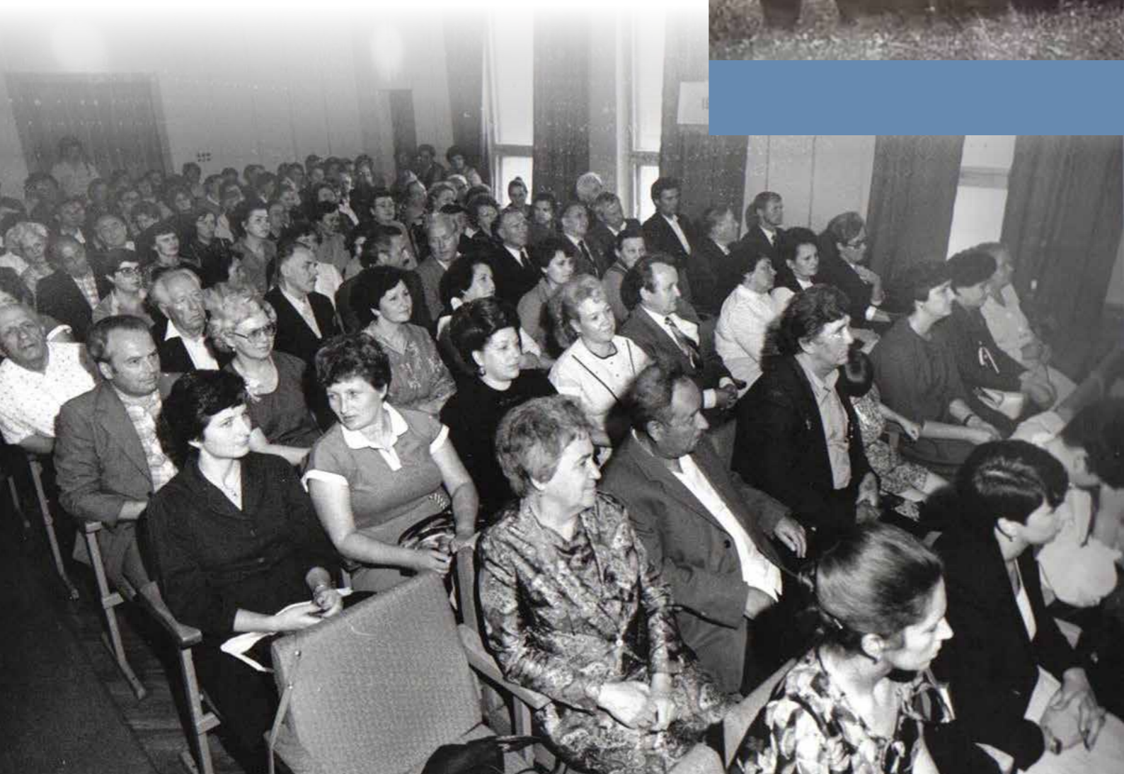
40-летие Брестской городской санэпидстанции. 1985 г.