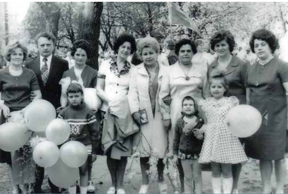
На первомайской демонстрации. 1974 г.